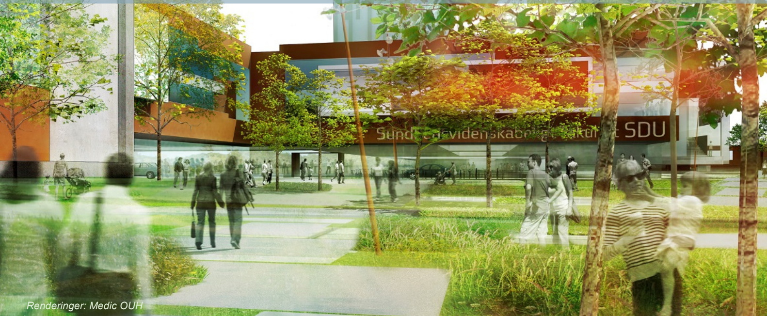
Renderinger: Medic OUH